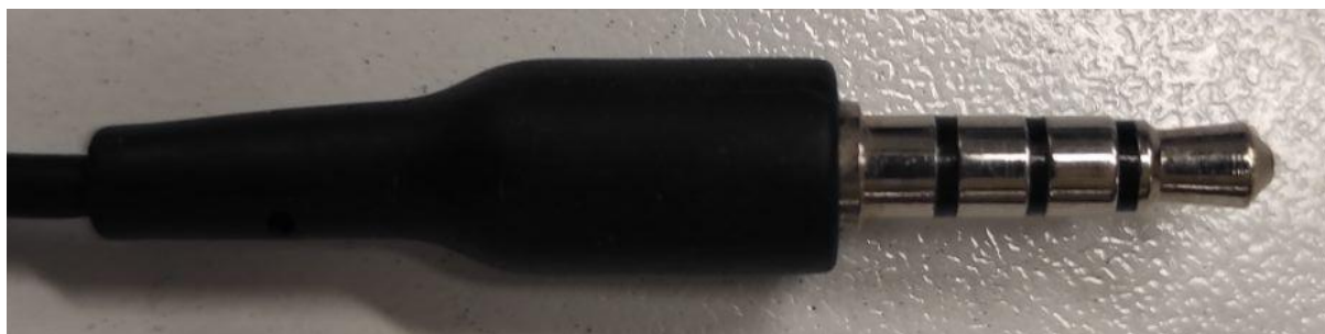
Connettore jack da 3.5"

Ad esempio gli auricolari, che ormai vengono largamente utilizzati con il cellulare possono andare bene.