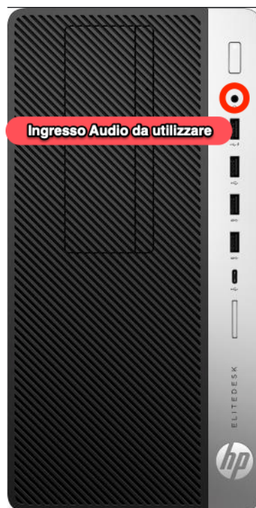
Foto 2 - Ingresso audio postazioni del laboratorio 2